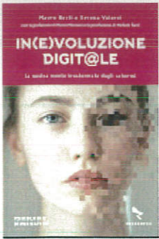
IN(E)VOLUZIONE DIGIT@LE.jpg 242K